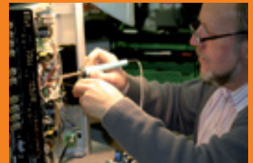
Reparatur von Fernseh- und HiFi- Geräten in eigener Meisterwerkstatt