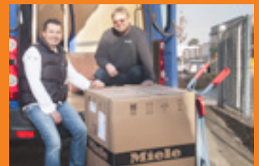
Autorisierter Miele Fachhandels- kundendienst, voller Service für Ihre Miele-Geräte, auch in der Garantiezeit!