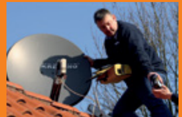
Installation und Reparatur von Sat- und Kabelempfangsanlagen