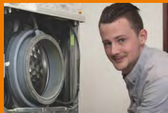
Reparatur von Haushaltsgeräten aller Marken