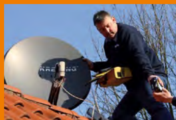
Installation und Reparatur von Sat- und Kabelempfangsanlagen