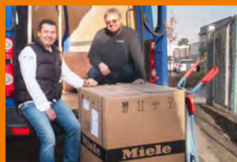
Autorisierter Miele Fachhandelskundendienst, voller Service für Ihre Miele-Geräte, auch in der Garantiezeit!